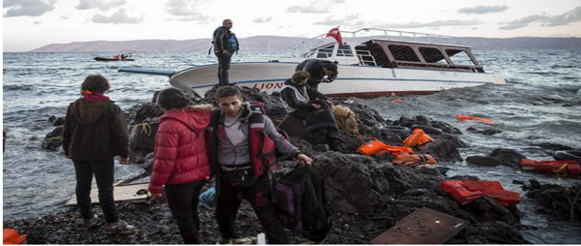
Şekil-2 Düzensiz Göçmen Taşımacılığı Yapıp Batırılan Turizm Teknesi