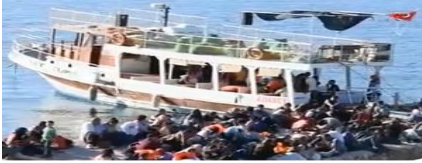
Şekil 1: Düzensiz Göçmen Taşımacılığı Yapan Bot

Günümüzde yaşanan Akdeniz'deki düzensiz göçmenlik sorunu; çatışma bölgelerinden kaçan sığınmacılar, istikrarsızlıktan kaynaklanan düzensizlikler ve yoksulluk karşısında Avrupa'da refah içerisinde yaşama umudu taşıyan göçmenlerin sığınma arayışının yasadışı yollarla ve kontrolsüzce gerçekleşmesinden kazanç sağlayan uluslararası suç örgütlerince yönlendirilmesinden kaynaklanmaktadır(Akçadağ, 2012:5). Yaşanan sorun Şekil-1 ve Şekil-2' de gösterilmiştir.