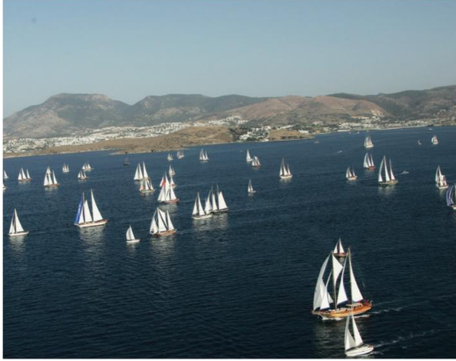
Resim 1: Bodrum guletleri

başlamıştır. Turizm geliştikçe guletler de gelişip, boyları büyümüştür. (www.muglakulturturizm.gov.tr).