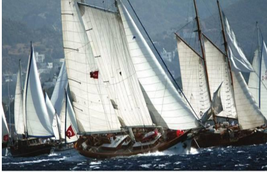
Resim 3: “ THE BODRUM CUP “

programında ki yarışlara katılımdır. Ayrıca bu kulüpler söz konusu yarışlara katılım yanında kendileri de gerek ulusal gerekse uluslararası düzey de yarışta organize etmektedir. Bunlardan bir tanesi Era Bodrum Yelken Kulübü tarafından organize edilen 2015 yılında 27.si yapılan “ THE BODRUM CUP” ismiyle geleneksel Gulet ve Thiriandillerin katılımıyla gerçekleşen ahşap yat yarışlarıdır.