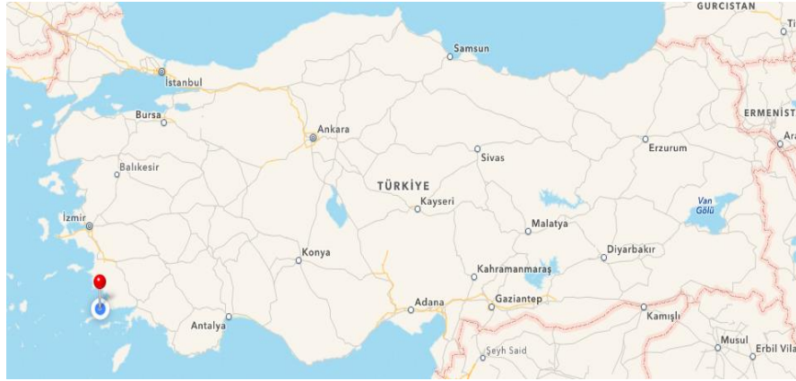
Şekil 1: Bodrum'un konumu

Bodrum, Muğla'nın 13 ilçesinden birisidir. Bodrum Türkiye'nin güneybatısında yer almaktadır. Ege Bölgesi'nde, Muğla iline bağlı bir ilçe olan Bodrum, doğu ve kuzeydoğusunda Milas, kuzeybatı, batı ve güneyinde ise Ege Denizi ile çevrilidir. İlçe kuzeyde Güllük, güneyde Gökova Körfezi arasında bir yarımada üzerinde yer almaktadır.