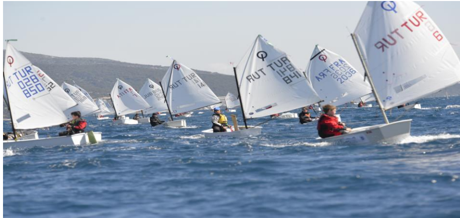
Resim 7: BIOR 2014'ten bir yarış görüntüsü