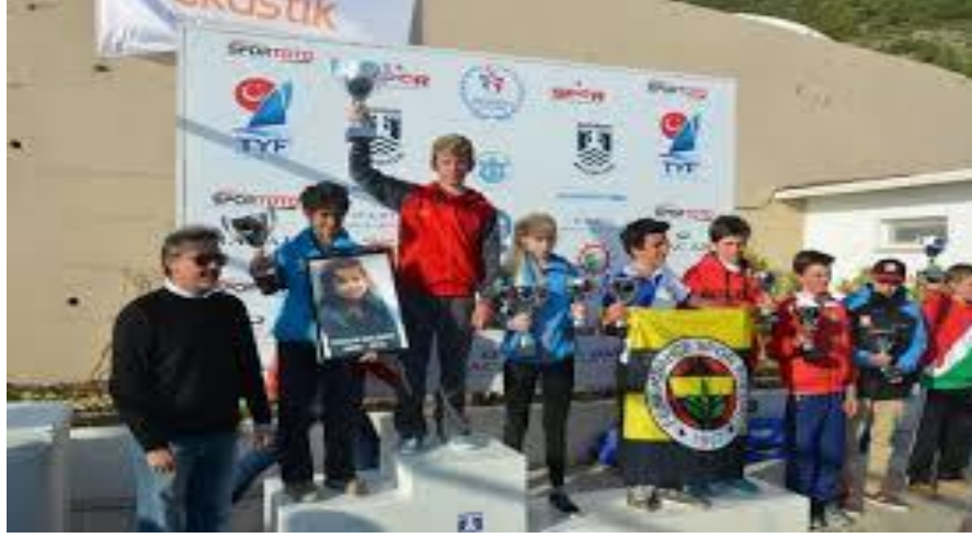
Resim 8: BIOR 2014'ten ödül töreni

Yukarıda belirtilen tüm katılımcıların yer aldığı bir yarışta katılımcıların yarış yerine gelmesinden yarış yerinden ayrılmasına kadar bir yarış süreci şu şekilde gerçekleşmektedir;