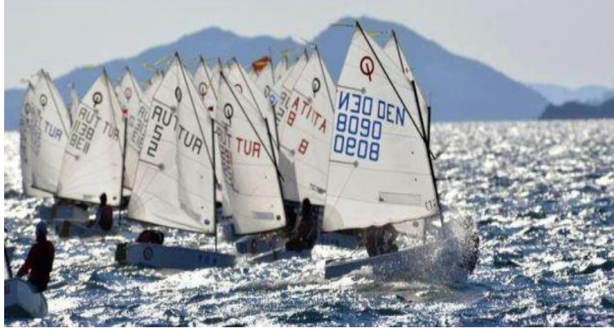
Resim 5: BIOR 2015'ten bir görüntü

Uluslararası bir organizasyonda yer alan katılımcı grupları şu şekildedir;