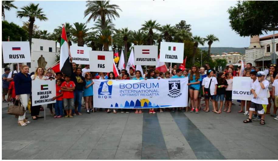
Resim 6: BIOR Açılış Töreni

Sonuç olarak, 200 kişilik bir optimist yarışında toplam katılımcı sayısı ortalama 450- 500 kişi aralığında değişmektedir.