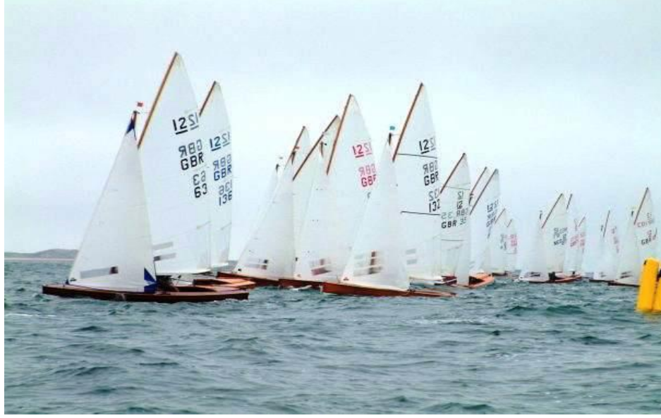
Resim 2: Şarpi ( Sharpie ) yelkenli tekne

gençler arasında yelken ilgi görüyordu. 1 Temmuzda kutlanan Denizcilik ve Kabotaj Bayramında 10-12 teknenin katıldığı yelken yarışları yapılıyordu (Hüseyin Biner ile yapılan görüşme).