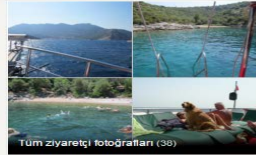
Tüm ziyaretçi fotoğrafları (38)

TripAdvisor'da Yorum Yapanların Altını Çizdiği Özellikler 70 yorumun hepsini okuyun